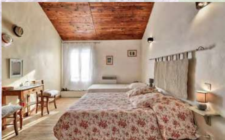
La Treille Dorée Gîte