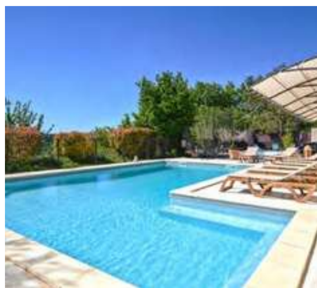
SPA DE NAGE Chauffé*